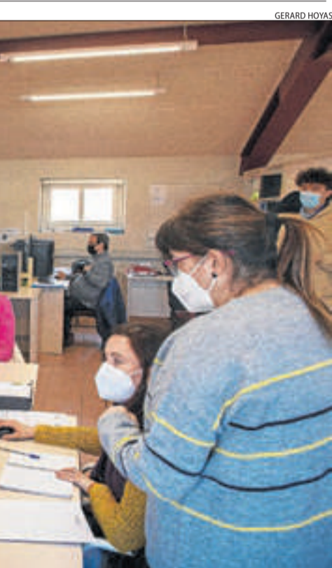
el qual els alumnes es posen a la pell d'empleats tots els seus departaments.